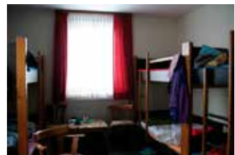
Schlafraum mit Doppelstockbetten