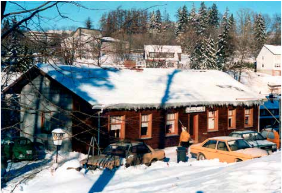
Unsere Skihütte im Winter 1979/1980

Ein Termin steht auch schon fest: Am 15.12. feiern wir das 40jährige Bestehen unserer Skihütte! Details hierzu findet Ihr im Vorwort.